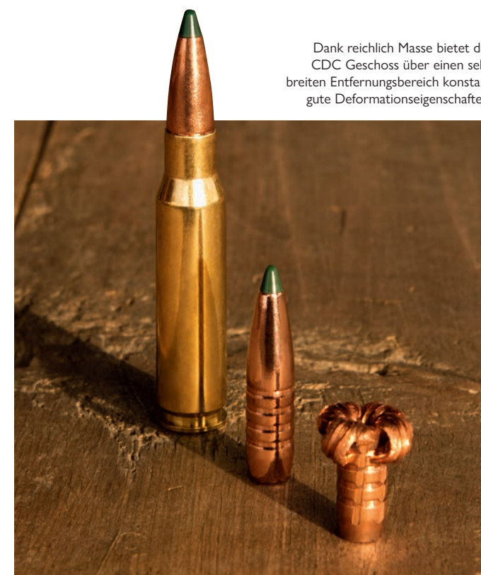
Dank reichlich Masse bietet das CDC Geschoss über einen sehr breiten Entfernungsbereich konstant gute Deformationseigenschaften.